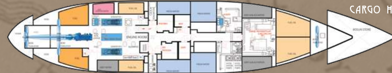
CARGO HOLD DECK