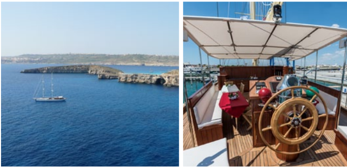
Die KAIRÓS nimmt Kurs auf Buchten und Malta's Hauptstadt Valletta

Doch Gozo hat noch mehr zu bieten: zauberhafte Dörfer und mächtige Kathedralen. Den Ggantija Tempel nahe der Ortschaft Xaghira, der rund 5800 Jahre alt sein soll und weltweit zu den am besten erhaltenen freistehenden Bauwerken der Welt gehört. Und auf der Westseite der Insel eine von der Natur geschaffene Attraktion, vor der die KAIRÓS ihren Anker werfen wird: den 20 Meter hohen Felsen, aus dem das Meer im Laufe der Jahrhunderte ein Fenster herausgewachsen hat, das „Azure Window“, das „Blaue Fenster“. Gleich daneben thront der Fungus Rock, auf dem eine schwammartige Pflanze wächst, von der die Johanniterritter im 16. Jahrhundert glaubten, sie könne Wunden heilen.