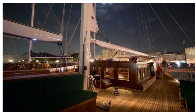
■ Für die maximal 18 Gäste an Bord der KAIRÓS wird es nie eng

Zwischen Felsen und Höhlen leuchtet kristallklares Wasser magisch in allen Blautönen des Farbspektrums. Leise klatschen die Wellen an den Bug der KAIRÓS. Zeit für ein Bad mit Karibik-Feeling. Und sollte Ihnen die Kulisse bekannt vorkommen – das kann sein: Die „Blue