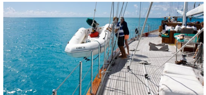
Die Crew der KAIRÓS hat das nächste Ziel im Blick

Von hier aus nimmt die KAIRÓS wieder Kurs auf die große Schwesterinsel, auf Malta. Vorbei an der Küste Gozos, die sich bis zu 176 Meter aus dem Meer erhebt. Hier und da ragt ein Kirchturm aus der Inselsilhouette, „der Papst war sogar mal auf Gozo“, wird vielleicht jemand an Bord einwerfen. Später kommt der Santa Marija Tower im Südwesten Cominos in Sicht, ein ockerfarbener Klotz, der hier im Auftrag des Malteserordens zur Verteidigung gegen Piraten errichtet wurde. Und dann, am letzten Tag der Reise, fährt die KAIRÓS wieder ein in den atemberaubenden Naturhafen, in dem es so anders aussieht als ein, zwei Inseln weiter. Atmen Sie durch, lassen Sie die Kulisse auf sich wirken. Lassen Sie sich verzaubern. Wie auf Comino. Wie auf Gozo. ■